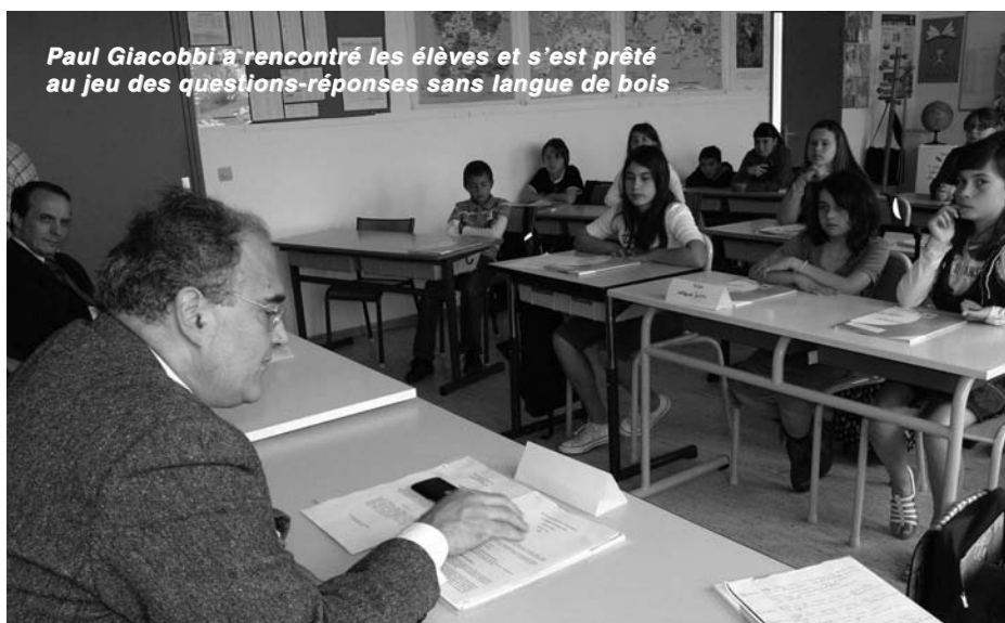
Paul Giacobbi a rencontré les élèves et s'est prêté au jeu des questions-réponses sans langue de bois

Le jury national, qui s'est réuni au début du mois de mai, a sélectionné trois propositions de loi qui seront donc débattues le jour du Parlement des enfants . Parmi ces propositions de loi, celle de l'école élémentaire de Folelli , visant à installer des casiers à code dans les CHRS (Centres d'Hébergement et de Réinsertion Sociale), afin d'inciter les