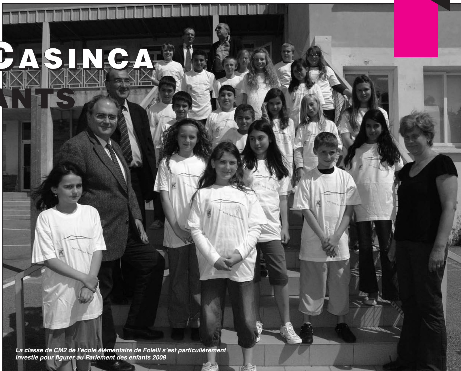
La classe de CM2 de l'école élémentaire de Foelli s'est particulièrement investie pour figurer au Parlement des enfants 2009

personnes sans domicile fixe à accepter l'accueil dans ces centres et ainsi favoriser leur réinsertion sociale.