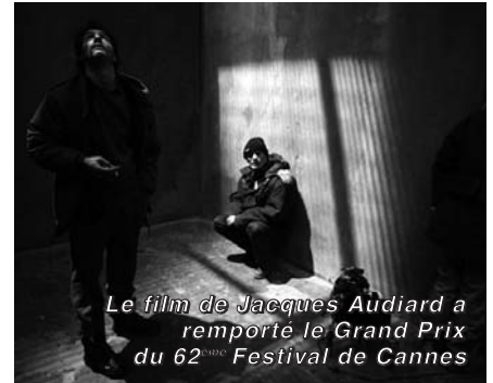
Le film de Jacques Audiard a remporté le Grand Prix du 62 ème Festival de Cannes